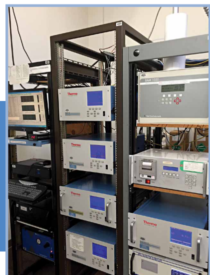
Giá thiết bị điển hình trong Trạm giám sát không khí