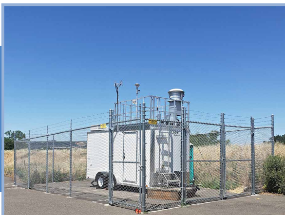
Trạm Giám Sát Không Khí Đang Hoạt Động của Air District

Các trạm giám sát không khí của Air District sẽ sử dụng các thiết bị phức tạp để liên tục giám sát không khí xung quanh nhằm tìm kiếm các chất gây ô nhiễm. Do những thiết bị này rất nhạy cảm nên bên trong trạm phải được duy trì ở một phạm vi nhiệt độ cụ thể, và thiết bị cần được đặt trong chòi kín hoặc trong nhà có lối vào trực tiếp từ mái nhà. Một số kiểu trạm giám sát nhất định được đặt trực tiếp trên mái chòi, trong khi đường dây lấy mẫu không khí đưa từ phía trên trạm vào các thiết bị được đặt trong nhà. Nhiều trạm giám sát không khí cũng bao gồm một tháp khí tượng đo tốc độ gió, hướng gió và các thông số khí tượng khác. Mặc dù nhiều trạm giám sát của chúng tôi được lắp đặt trong các nhà lưu động nhưng thường được sử dụng để thu thập dữ liệu trong thời gian dài và luôn ở một vị trí cố định sau khi đã chọn được địa điểm.